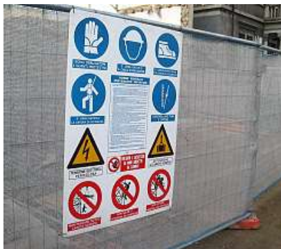
Entro il 26 agosto il titolare dovrà mettere in sicurezza il cantiere

Infine dovrà ripristinare la recinzione del cantiere, oltre a mettere in pratica «ogni altro