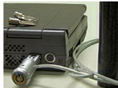
Anche i dispositivi informatici hanno il loro antifurto

Per tutta la durata della fiera saranno inoltre organizzati workshop, seminari, convegni